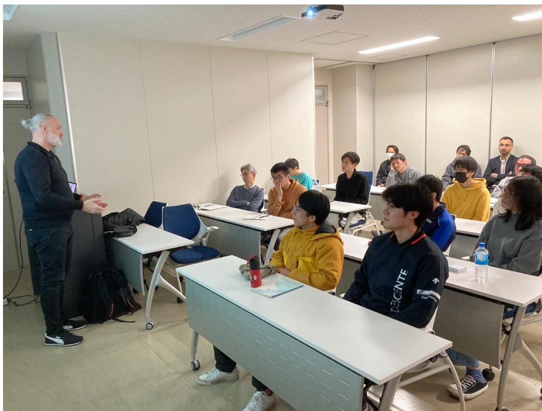
レアメタル回収・分離法の説明を受ける受講者